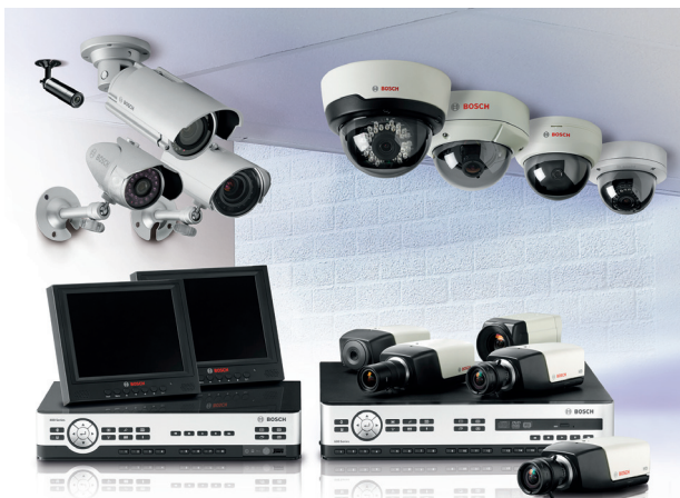
Les produits de vidéosurveillance proposés par Bosch Security Systems France comportent des dômes fixes et mobiles innovants.

C'est pourquoi Bosch est membre fondateur de l'ONVIF ( Open network video interface forum ) ou met à disposition librement son kit de développement logiciel (VideoSDK) pour intégration avec des solutions tierces. L'objectif est de s'assurer que l'ensemble du flux est parfaitement exploitable au mieux des besoins du client, sans risque de rupture de la chaîne lié à des problèmes d'incompatibilité. Autre initiative : « Bosch Security Academy », le centre de formation agréé depuis 2008, destiné à faire évoluer les compétences des équipes techniques de nos partenaires sur les nouveaux produits et les nouvelles technologies. Bosch propose aussi une Certification « Vidéo IP Bosch » ouverte à tous les techniciens confirmés de nos clients intégrateurs ou distributeurs spécialistes. Elle permet l'obtention d'un diplôme portant sur les connaissances de la mise en service d'un système de vidéosurveillance IP Bosch BVMS et les scripts. Notre catalogue de formation est disponible sur notre site www.boschsecurity.fr De plus, nous allons renforcer notre présence en multipliant les rencontres, les réunions et les démonstrations », annonce Denis Castanet. « Le 9 février prochain, nous organiserons une session de mise en situation de nos produits. Ce sera une véritable démonstration de la valeur ajoutée de la marque Bosch. » Rendez-vous est pris. ●