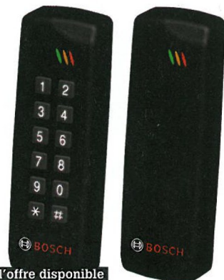
2 nouveaux lecteurs Mifare complètent l'offre disponible

Deux nouveaux lecteurs de proximité viennent enrichir la gamme proposée par Bosch. Intégrant la technologie Mifare, ils sont équipés de sorties pour liaisons Wiegand 16 bits et RS485 sélectionnables par simple switch.